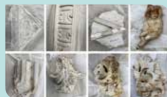
Decoratief metselwerk van plafond en muren wordt hersteld.