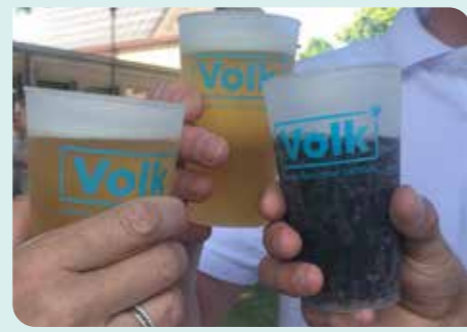
Leen GRATIS herbruikbare bekertjes.

Wist je dat VOLK* 400 herbruikbare bekertjes beschikbaar heeft voor uitleen? We merken dat op evenementen nog vaak wegwerpbekertjes worden gebruikt en dat herbruikbare bekertjes moeilijk te huur zijn in Vosselaar. Daarom bieden wij onze herbruikbare bekertjes gratis aan Vosselaarse verenigingen aan. Zo dragen we samen bij aan een afvalvrije toekomst en ondersteunen we lokale initiatieven. Dit is slechts één van de vele stappen die we zetten om Vosselaar milieuvriendelijker te maken. Het enige dat we vragen is dat ze na gebruik schoon en droog worden ingeleverd. Voor meer informatie of een aanvraag, stuur een mail naar info@volkvosselaar.be