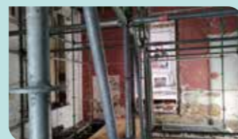
Stuttingen om de stabiliteit tijdens de werken te behouden.