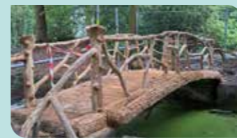
De bruggetjes worden in originele toestand gerestaureerd.