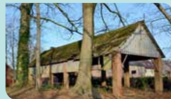
De dragende muren en de houtstructuur van het dak werden hersteld en geschilderd.

De restauratiewerken aan de structuur worden zoals gepland afgerond in het najaar van 2024. Ondertussen beoordeelt een professionele jury de voorstellen voor een nieuwe invulling van het hoofdgebouw. VOLK* streeft naar een herbestemming die Het Hof toegankelijk maakt voor een breed publiek en het bos als groen hart voor Vosselarenaren en toeristen versterkt. De uitbater zal zelf nog de nodige investeringen moeten doen voor de technische voorzieningen en binnenafwerking. Als het gebouw uitgebreid wordt met een orangerie, vraagt VOLK* om een inplanting die het historische gebouw eer aan doet en en overlast voor de burens vermijdt. Blijf op de hoogte en schrijf in op onze tweewekelijkse mailing via volkvosselaar.be/contact .