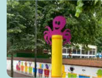
VOLK* kiest voor veilige, gezonde en groene schoolomgevingen die duurzame mobiliteit en ontmoeting stimuleren.

weegprikkels, groen, en ruimte voor voetgangers en fietsers. De fiets- en schoolstraten, geïnitieerd door Gilles Bultinck, maken deel uit van dit plan. Ook in de volgende legislatuur blijft VOLK* werken aan een betere verkeersveiligheid!