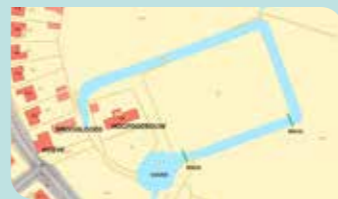
Zowel de droogloods, de hoeve, als de pastorie worden gerestaureerd.