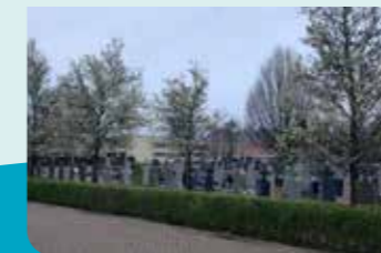
Korte haag, nieuwe bomen en een grasweide dragen bij tot een groener centrum.

De opwaardering van de groene ruimte in Vosselaar blijft voor VOLK* een sterk aandachtspunt in het nieuwe Centrumplan . Dit zal vooral werk zijn voor de volgende legislatuur maar er worden reeds voorbereidende stappen gezet. De haag langs de begraafplaats in de Maurits Pottersstraat werd ingekort en er werd een grasweide voorzien waarnaast nieuwe bomen werden geplant. Ook de historische grondenruil met de Kerkfabriek, waardoor de site aan de Konijnenberg openbaar domein werd, zal ons toelaten de Konijnenberg een prominente plaats te geven in een groener Centrum.