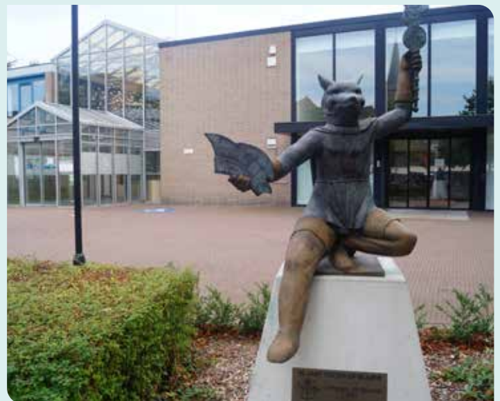
VOLK* is geëngageerd en steunt de verenigingen.