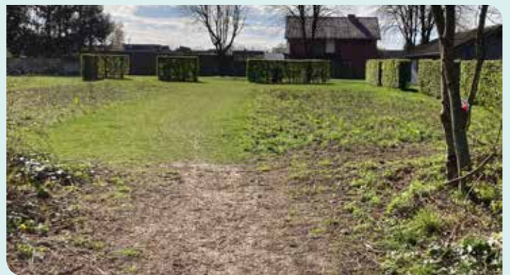
Ontharding, zoals op het Akkerveld, houdt uw kelder droog.

Om sluikstort en zwerfvuil tegen te gaan, blijven we via OVAM administratieve boetes uitschrijven. Dit in combinatie met een financiële retributie om de werkelijke kosten van de opruiming bij de vervuiler te leggen. Dankzij het ondersteunen van de zwerfvuilvrijwilligers en sensibiliseringscampagnes houden we ons grondgebied schoon en doen we een beroep op het verantwoordelijkheidsgevoel van onze inwoners.