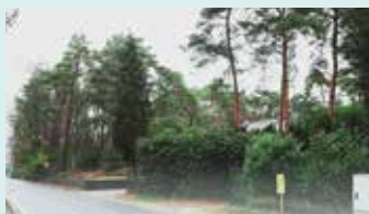
VOLK* staat garant voor behoud groene ruimte

Een financieel gezond en zelfstandig Vosselaar. Pag. 11