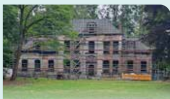
VOLK* maakt van het Hof een ontmoetingsruimte en wijklokaal