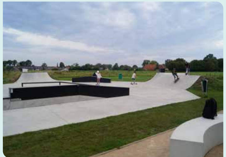
VOLK* zorgt voor goede sportinfrastructuur.

VOLK* is trots op het nieuwe skatepark en de beachvolleybalvelden en staat open voor nieuwe soortgelijke initiatieven.