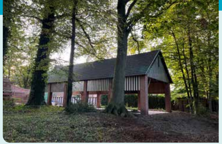
VOLK* heeft plannen voor de droogloods als ontmoetingsruimte.

De gerestaureerde hoofd- en bijgebouwen van het Hof krijgen een prominente rol in het gemeenschapsleven in Vosselaar. Zij groeien uit tot een gezellige toegangspoort van het omliggende groene domein. VOLK* wil ook graag de droogloods voorstellen als nieuwe ontmoetingslocatie. De hoeve kan een nieuw wijklokaal worden en ter beschikking gesteld worden aan verenigingen in Vosselaar.