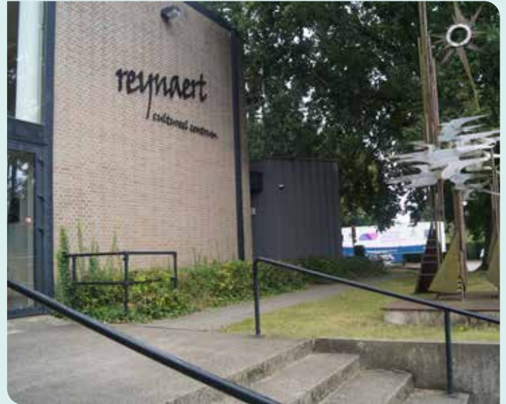
VOLK* wil investeren in de foyer en de gemeentehal.

VOLK* geeft ruimte aan een open en goed functionerende Cultuurraad , waar elke vereniging aan bod komt en die het lokaal bestuur advies verleent. De cultuurfunctionaris heeft een zeer belangrijke rol als ondersteuner van initiatieven van verenigingen en als bruggenbouwer tussen gemeentelijke initiatieven en verenigingen.