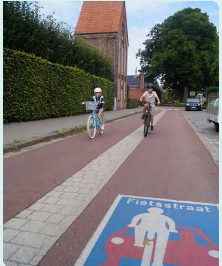
Fietsstraten voor een veilige schoolomgeving.

Verder blijven we hameren op vlottere trein- en busverbindingen tussen onze regio en de centrumsteden .