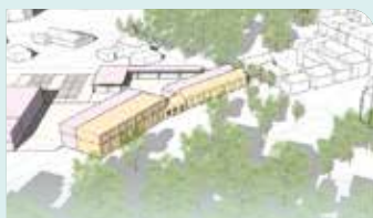
De vernieuwde centrumschool in een grotere Konijnenberg is prioritair voor VOLK* p 2