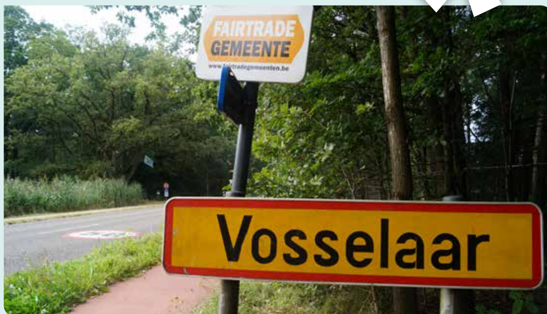
VOLK* ijvert voor de zelfstandigheid van Vosselaar.