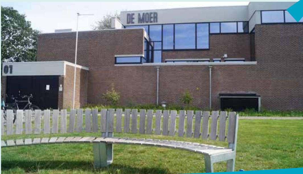
Een gezond en zorgzaam Vosselaar.

VOLK* heeft ook aandacht voor armoede en ontwikkeling verder weg . Wij ondersteunen projecten van Vosselaarse inwoners in landen die het economisch moeilijk hebben.